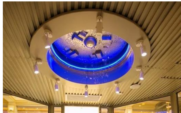
雪華房 (せっかぼう)