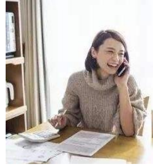
MS. Alhara Health consultant

Outstanding representative in hot spring field of Japan, health guidance expert team