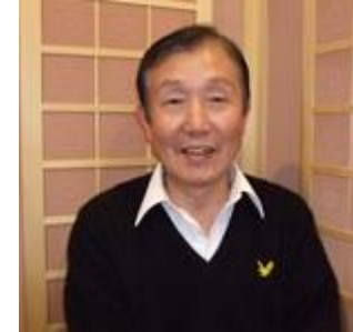
MR. Etou Health consultant